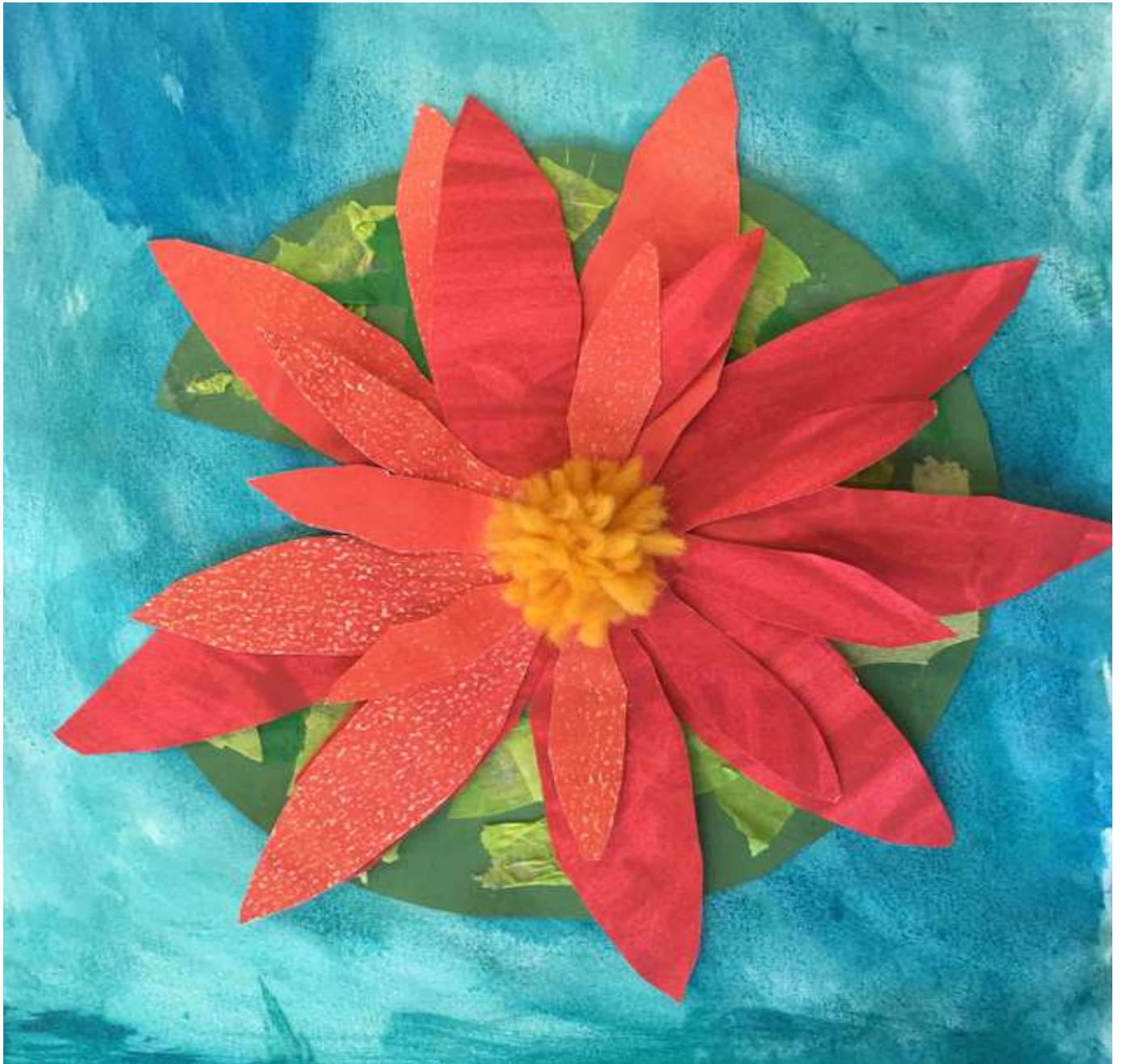
Titelbild. Seerose. Joya 1a