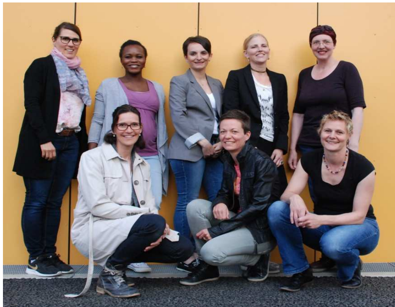
'Eltern mit Wirkung'